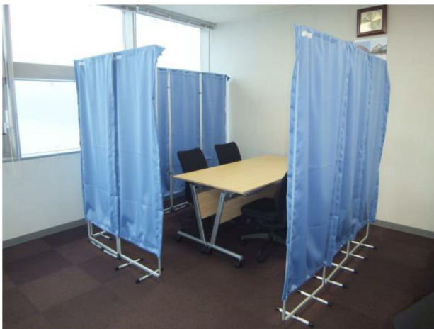
事務所の間仕切として…