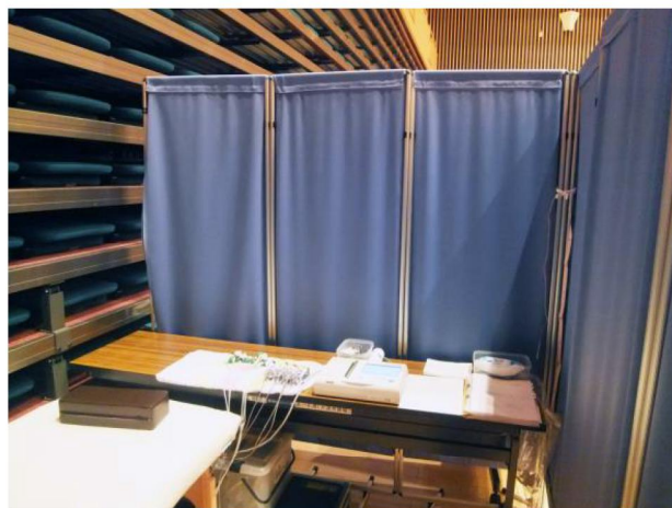
巡回健診時の間仕切として…